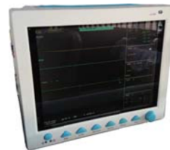
バイタルサインモニター